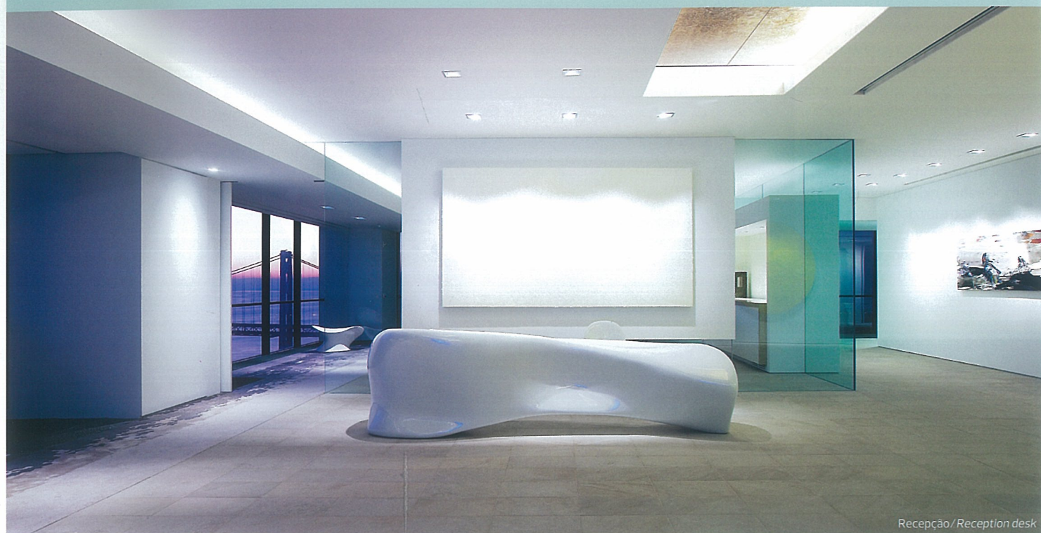
Recepção / Reception desk