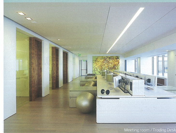
Meeting room / Trading Desk

TEXTO: ALEXANDRA NOVO