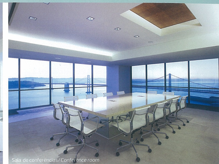
Sala de conferências / Conference room