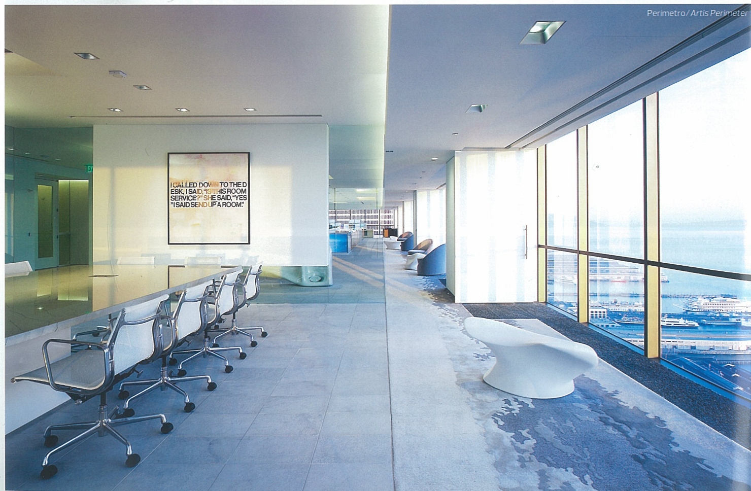
Perímetro / Artis Perimeter

TEXTO: ALEXANDRA NOVO