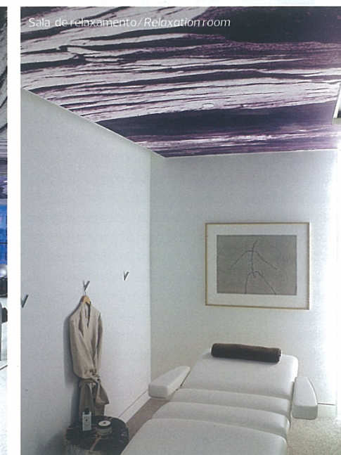
Sala de relaxamento / Relaxation room